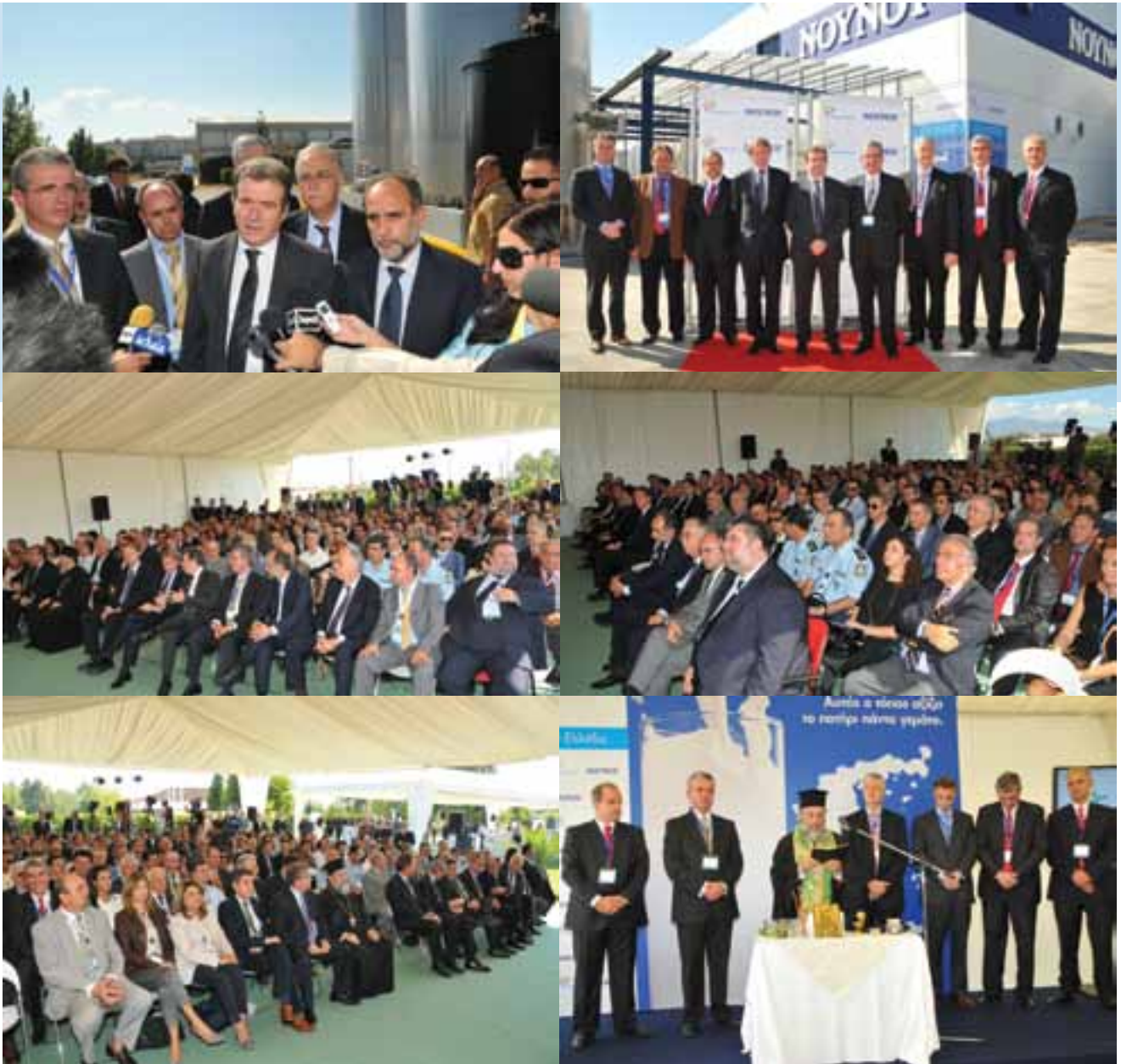
Φωτογραφίες από την εκδήλωση

Με τη νέα επένδυση, το παραγωγικό δυναμικό του εργοστασίου Friesland Campina στη ΒΙ.ΠΕ. Πατρών υπερδικαπλασιάζεται, φθάνοντας τους 80.000 τόνους γάλακτος ετησίως , όγκος ο οποίος αντιστοιχεί στο 15% περίπου της συνολικής παραγωγής της ελληνικής κτηνοτροφίας.